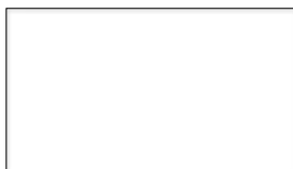
biela (RAL 9002)

Vzorkovník aktuálnych odličňov Primalex Jednovrstvová farba 2v1: