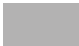
strieborná (RAL 9006)