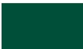
zelená (RAL 6005)